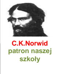
C.K.Norwid patron naszej szkoły